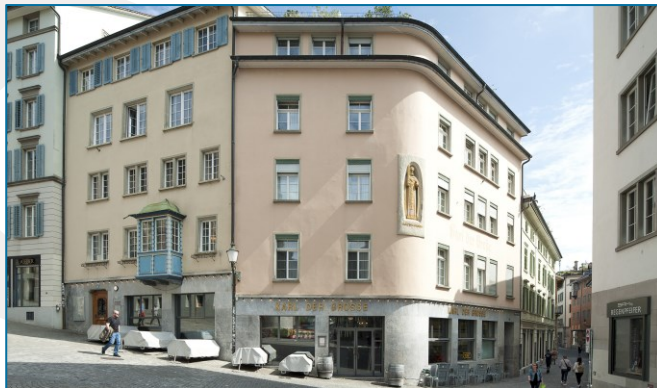
Zentrum Karl der Grosse, Kirchgasse 14, 8001 Zürich

Anreise: Tram Nr. 4 oder 15 bis Haltestelle Helmhaus